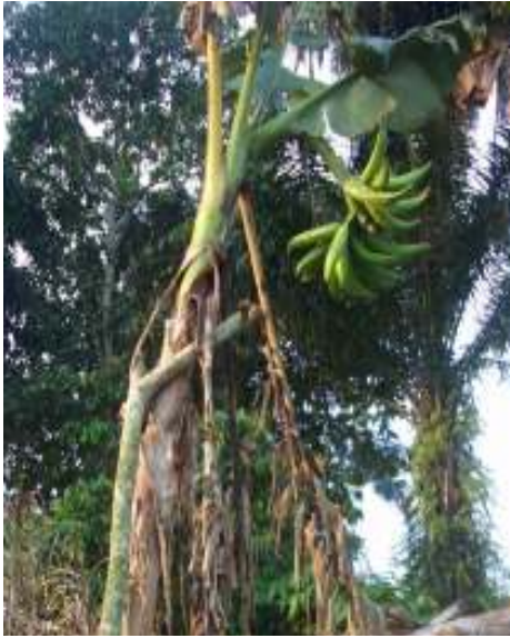
Banane Plantain : “Vrai Corne”

gue période serait suffisante pour permettre aux mutations somatiques de générer une grande diversité et aux agriculteurs de propager les cultivars ainsi disponibles. Certaines variations n'ont aucune importance agronomique ou économique. A titre d'exemple, près de la moitié des accessions de la collection de l'UNIKIS sont des mutants de couleurs d'autres cultivars. Par contre, des mutants comme les plants nains ou précoces peuvent être bénéfiques aux agriculteurs, même s'ils produisent des régimes moyens ou même petits. Actuellement, la col-