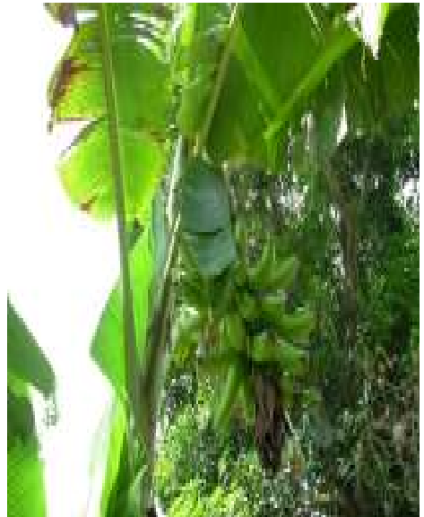
Banane Plantain : “Faux Corne”

sont originaires de la zone Asie-Pacifique, les bananiers plantains ont nécessairement été introduits en Afrique. Actuellement, il n’est pas possible de dire combien de cultivars ont été introduits dans le continent. Néanmoins, comme les cultivars du type French sont les seuls bananiers plantains à avoir une inflorescence mâle à maturité, ils peuvent être considérés comme le type original des tous les bananiers plantains. Si un ou plusieurs plantains type French ont été introduits sur le continent il y a 3000 ans comme le suggère les preuves archéologiques, cette lon-