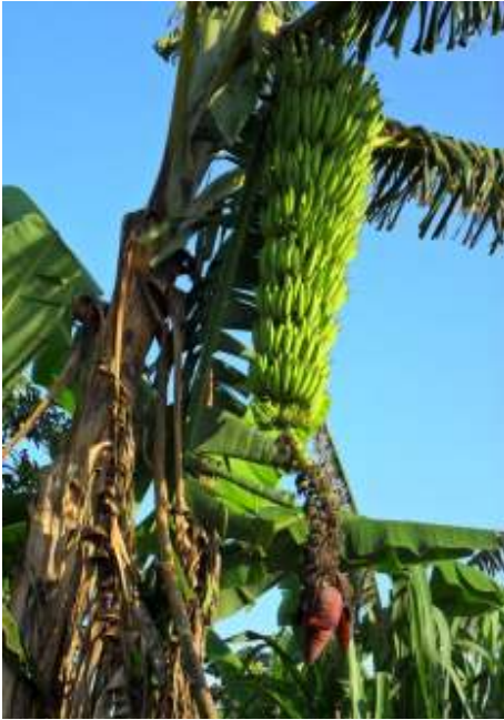
Banane Plantain: “French géant”

vars au marché et le court cycle de leur production. Cependant, d’autres critères, comme par exemple la tolérance à la sécheresse, pourrait expliquer pourquoi ces cultivars sont beaucoup plus répandus dans les champs des agriculteurs. La grande diversité des cultivars de bananiers plantains du type French pourrait être due à une longue période de culture de bananiers plantains dans la forêt humide du bassin du Congo.