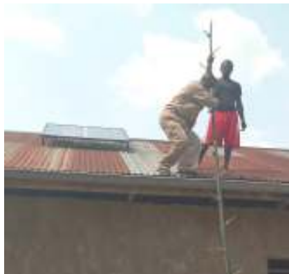
Installation des panneaux solaires : rendre disponible l'énergie renouvelable à l'île Mbiye

Une pompe à eau et des panneaux solaires sont prévus à Batiamaduka.