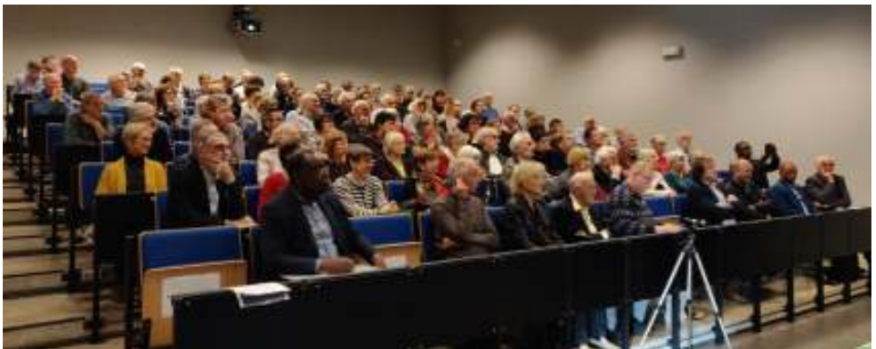
126 participants au débats de "20 ans Kisangani asbl"

La situation au Congo se dégradait peu à peu et nous apercevions une sous-alimentation chez les enfants. C'est ainsi que nous nous sentions obligés de prendre des initiatives nécessaires. Depuis 1999 nous avons créé une asbl.