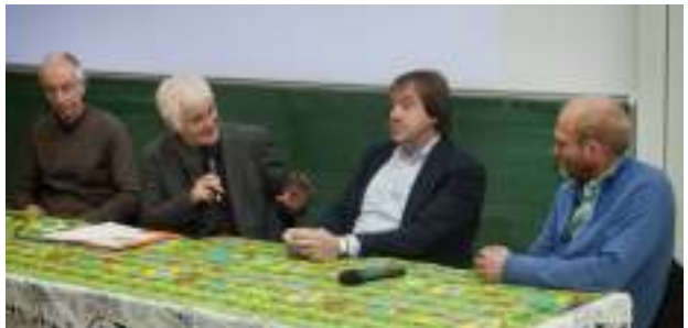
Débat scientifique