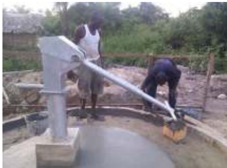
Installation d'une Pompe à eau à l'île Mbiye : rendre disponible de l'eau à l'école et à la population