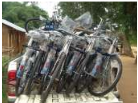
Appuis aux enseignants des écoles (Clara de l'Ile Mbiye et Masako) par le moyen de transport (vélo)