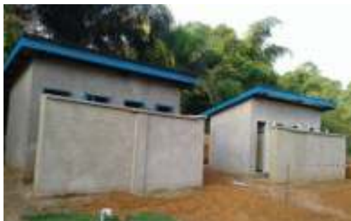
Construction des latrines pour les écoles (à Masako et à l'île Mbiye)

Une pompe à eau et des panneaux solaires sont prévus à Batiamaduka.