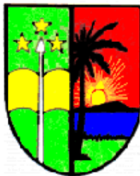
Faculté des Sciences Université de Kisangani