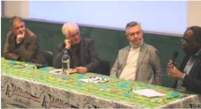
Débat politique