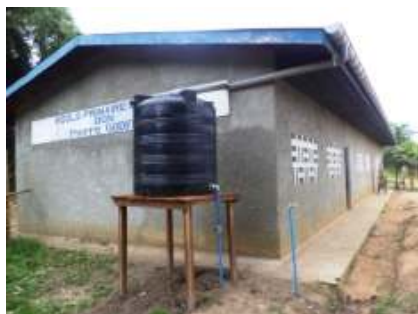
Installation des gouttières et réservoirs d'eau au niveau des écoles (Masako et Clara de l'île Mbiye)