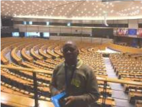
Le Parlement Européen.

squelette du Dinosaur dont la taille était à environ 6 m de longueur et 7 m de haut, taille très impressionnante à voir.