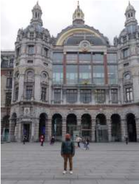
Paluku devant la Gare Central d'Anvers.

notions théoriques que je n'avais comprises à l'université, je les ai comprises après avoir vu ce qui se fait concrètement en pratique ; c'est le cas notamment de la Cryoconservation.