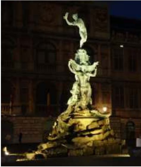
La Grande Place avec la statue de Brabo.

par les tunnels sous l'Escaut contrairement à Kisangani où les pirogues à pagaie et hors bords sont mises en contribution pour la traversée de la rive Droite à la rive Gauche du fleuve Congo et vice-versant. Le soir du même jour, j'ai vu la cathédrale d'Anvers avec sa tour qui était en cours de réfection. Il faut noter que cette tour est très haute de telle sorte que j'avais du mal à estimer la hauteur *.