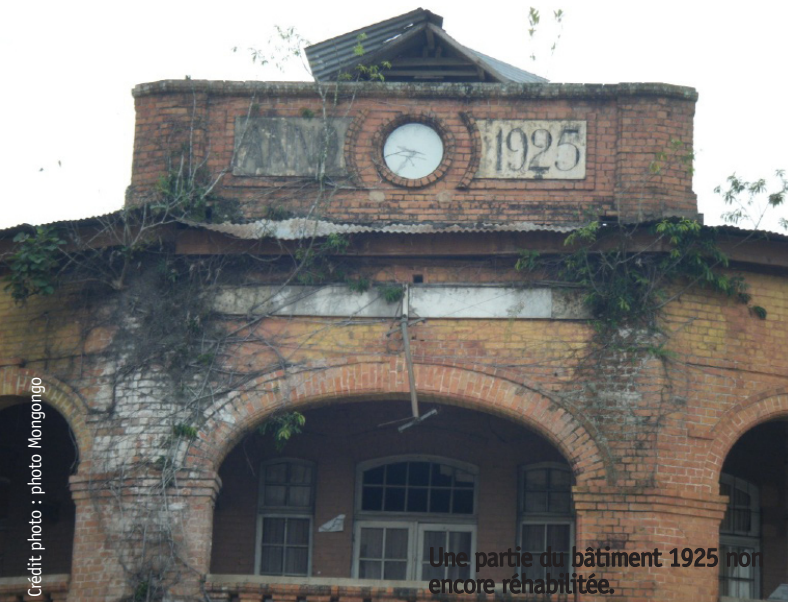
Une partie du bâtiment 1925 non encore réhabilitée.

Ce bâtiment d'une dizaine d'appartements abrite actuellement trente bureaux des services de l'Etat : deux ministères provinciaux, la division des affaires intérieures considérée comme héritière directe du pouvoir colonial, la division de l'agriculture, du développement rural, de l'industrie, petite et moyenne entreprise et artisanat (IPMEA), et la