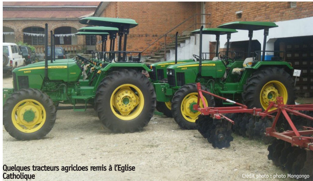
Quelques tracteurs agricoles remis à l'Eglise Catholique