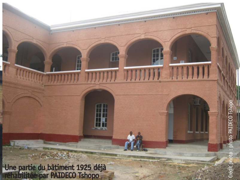
Une partie du bâtiment 1925 déjà réhabilitée par PAIDECO Tshopo