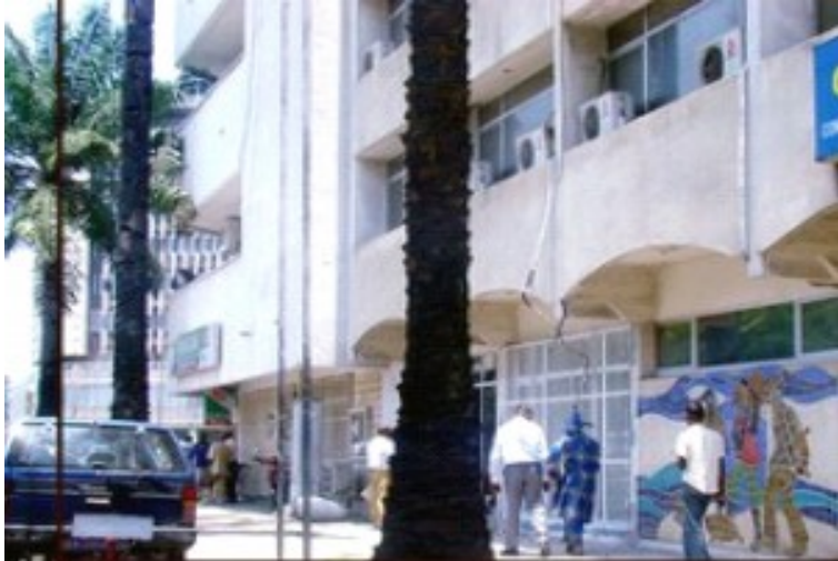
Immeuble LMC-AMICONGO, 6ème étage, Avenue des Aviateurs N°13, Place de la poste Commune de la Gombe – Kinshasa (RDC)

mouvement de reprise dont l'essor entraîna un gonflement sensationnel des courants de transports entre la Belgique et sa colonie le CONGO BELGE.