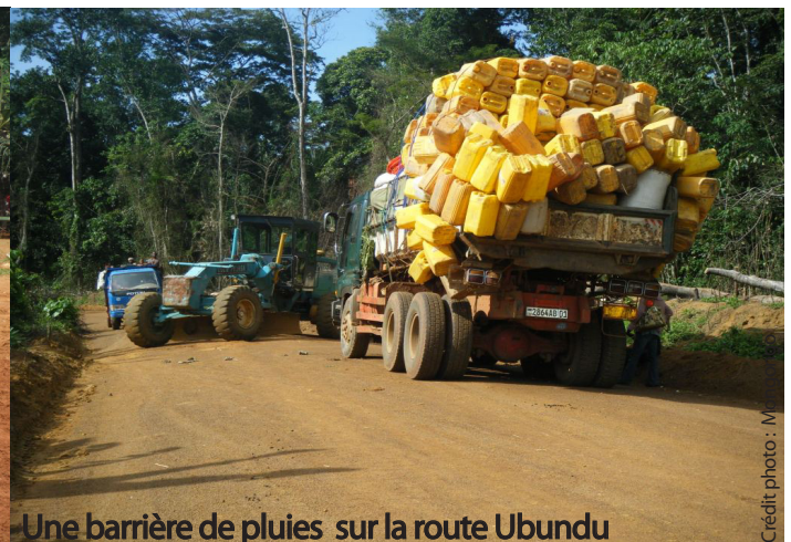
Une barrière de pluies sur la route Ubundu

nouvellement créé ou revitalisé par le retour des populations. Le village Lusa II à 98km a été créé par la population venue de Bagwasi à environ 60 km dans le secteur Walengola Babila en pleine forêt. «Ils n'ont pas trouvé d'espace dans mon village», explique Aradjabu Kabali, chef du village Lusa I.