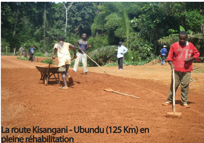
La route Kisangani - Ubundu (125 Km) en pleine réhabilitation

à présent sur financement de la coopération britannique a opté pour la mise en place de barrières de pluies : après de fortes précipitations, la route est fermée à la circulation pendant 4 à 5 heures le temps qu'elle sèche. Six barrières métalliques sont en installation. «Le bourgmestre nous a instruit de n'ouvrir qu'à 13h aujourd'hui pour protéger notre route», déclare un agent communal et les éléments de la Police routière aux camionneurs voulant à tout prix franchir la barrière de sortie de la commune Lubunga. «Nous sommes obligés des fois de barrer la route avec un bulldozer suite à l'incompréhén-